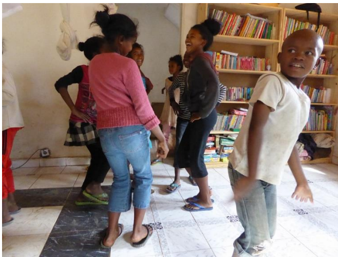
Après le repas, c'est disco !