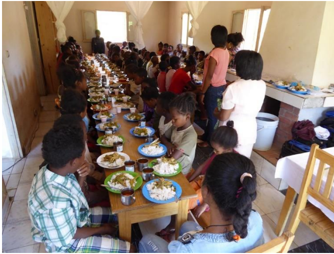
Le repas est prêt : Masoto! Bon appétit !