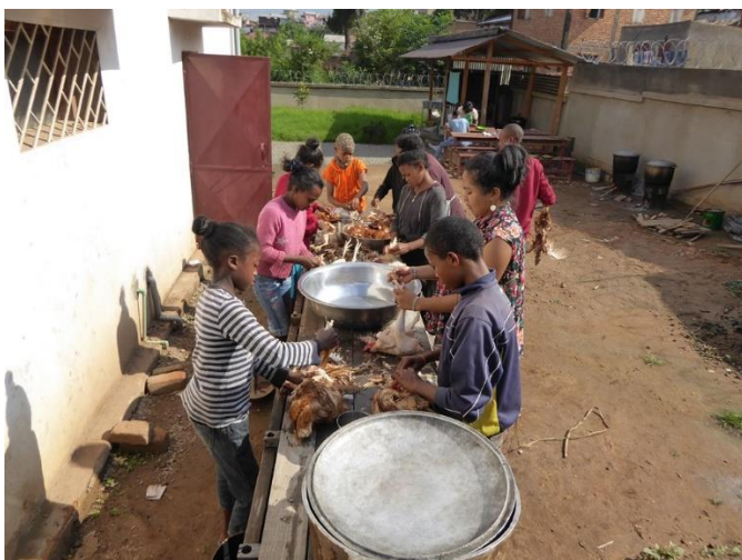
Préparation des poulets

Le budget pour le voyage des touristes suisses était bien calculé. Avec l'excédent j'ai pu financer la fête de Noël pour les enfants de l'AEJT - un grand merci aux participants du voyage ! Moments de joie et ambiance de fête pour les enfants. Les enfants ont fêté Noël dans le centre et ils ont vécu des moments joyeux. La tradition veut que les enfants reçoivent en ce jour un vrai repas, même avec de la viande. C'est peut-être le seul jour de l'année où les enfants mangent de la viande. Le repas traditionnel malgache est le « poulet gasy aux petits pois » (Malagasy, spécialité malgache), servi naturellement avec du riz. Le repas a été préparé par une équipe de cuisine composée de onze enfants et de quatre éducatrices. À 11h, les autres enfants sont arrivés au centre, ils étaient 83 en tout. La fête a été parfaitement organisée, une tâche pas facile avec autant d'enfants affamés.