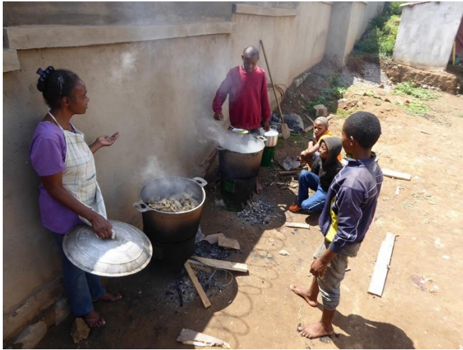
Les marmites de poulets et de petits pois