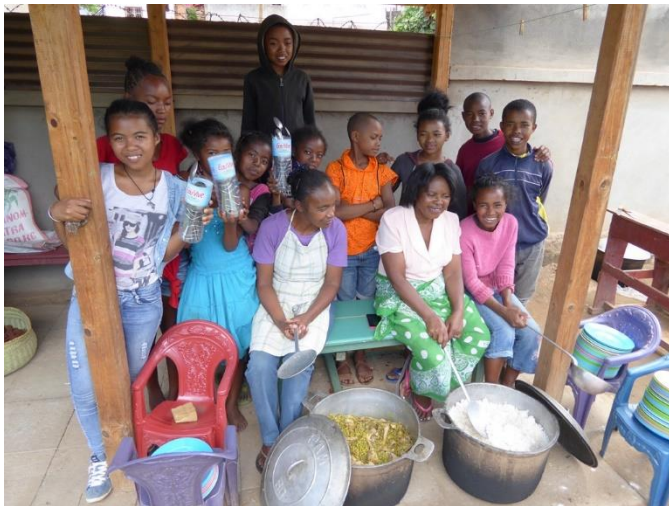
L'équipe de cuisine avant de servir