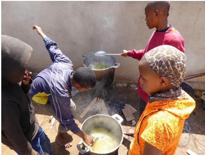
Les petits pois sont ajoutés aux poulets